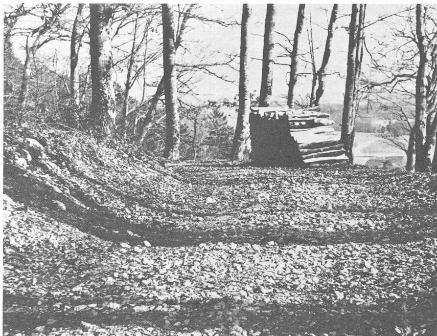
L'exploitation des forêts: une tâche qui demande clairvoyance et compréhension du rôle de la nature sur le plan tant écologique qu'économique.

Après avoir rempli la fonction d'expert aux examens des ingénieurs civils REG A (degré universitaire). Après son élection à la présidence de la fondation, il a habilement présidé les séances du conseil de fondation et du comité de di-