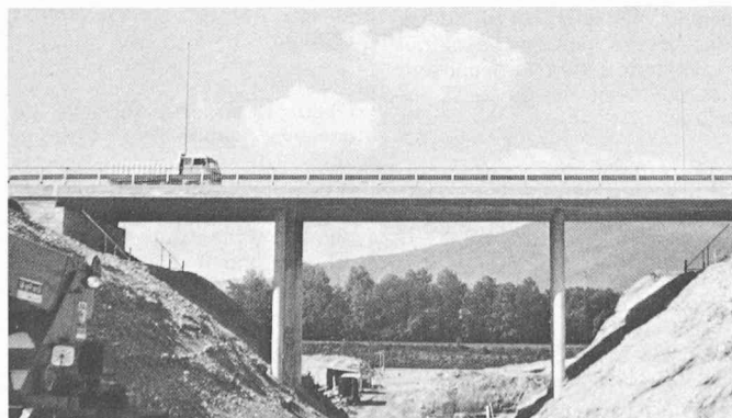
Pont à Augst, Bâle.