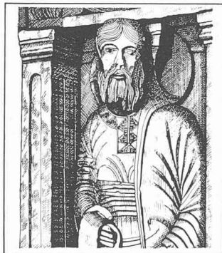
Saint-Gilles du Gard (F), abbatiale. Portail occidental. Fragment d'un bas-relief roman, 2 e moitié du XII e siècle.

d'innombrables créateurs, de l'Antiquité à nos jours, sont restés inconnus voire anonymes, ils participaient à la vie intellectuelle de leur temps, s'étaient nourris du legs du passé. L'art est donc la véritable et la seule synthèse des courants de chaque époque. Evidents ou masqués par une symbolique