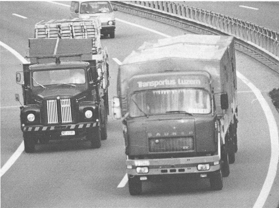
Poids lourds: est-ce aux automobilistes de subir et de financer leurs évolutions « sportives »?