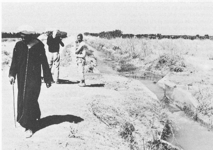
Fig. 2. — L'irrigation est un facteur de production décisif en zone aride. Cependant seule une utilisation judicieuse de l'eau permet d'en tirer un bénéfice maximal.

Les rejets de fonds pratiqués pour l'évacuation des sédiments du bassin libèrent