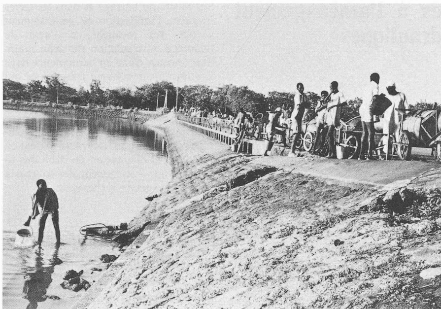
Fig. 1. — L'impact global d'un barrage ou d'une retenue d'eau n'est pas toujours facile à prévoir. Une approche pluridisciplinaire permet souvent d'éviter ou, tout au moins, d'atténuer les conséquences défavorables de l'ouvrage.

des terres riveraines. Ainsi en Egypte pendant des millénaires les crues du Nil déposaient une précieuse couche de limon sur les champs inondés. Aujourd'hui le haut barrage d'Assouan retient les sédiments fertiles et les paysans doivent répandre des engrais artificiels. Ce même pays a vu la pêche à la sardine s'effondrer après la mise en eau du barrage. Autrefois source de revenus importants pour l'Egypte, les sardines ont pratiquement disparu du Nil suite au déficit de sédiments, déficit ayant occasionné une diminution du plancton qui nourrissait les sardines.