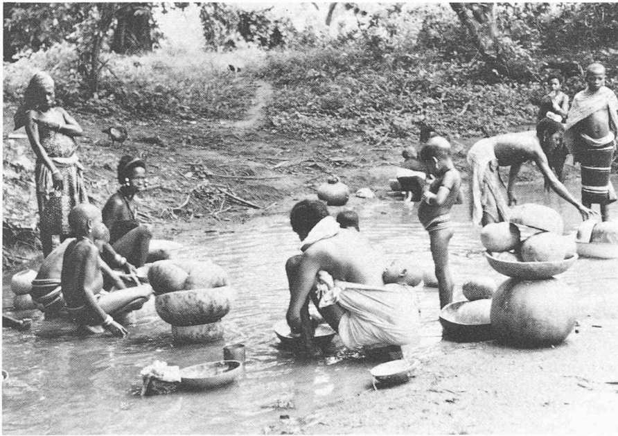
Fig. 3. — L'information et l'éducation des populations sont indispensables au succès de tout aménagement hydraulique.

une eau de fort mauvaise qualité qui peut occasionner de graves dommages à la faune et à la flore.