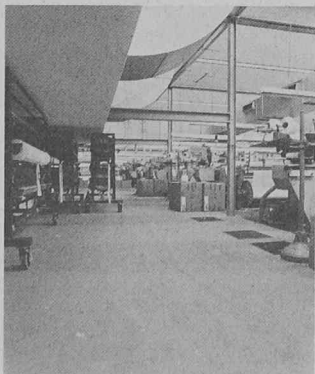
Assainissement d'un sol industriel, notamment avec colmatage des fissures, des trous et des failles.

Il en résulte des trous, des fissures ou d'autres dommages qui mettent en cause la sécurité et entravent les activités industrielles. L'assainissement des sols devient inévitable, quels que soient les coûts et le manque à gagner qu'il occasionne, du fait de l'interruption des activités productives dans les locaux concernés.