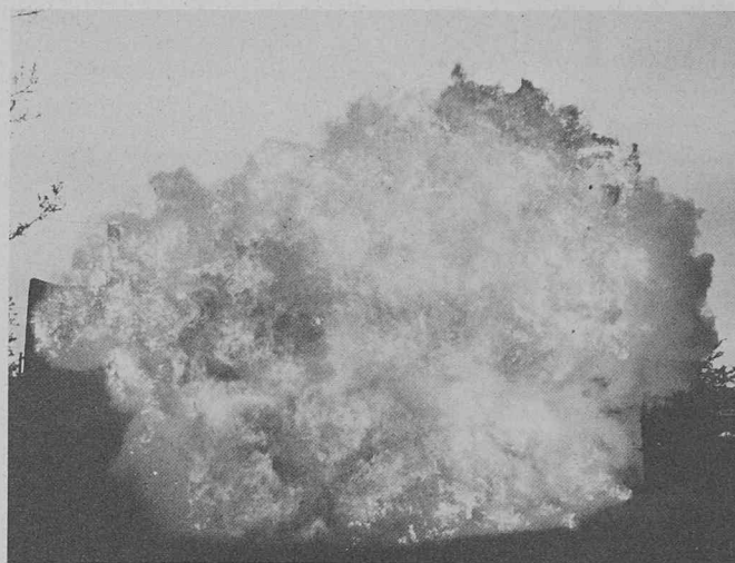
Coup de poussière: un risque à éviter par un filtrage adéquat.