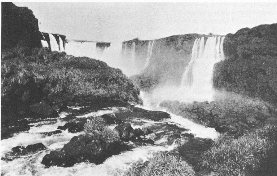
Kaléidoscope brésilien: Les chutes d'Iguaçu, dans l'Etat du Paraná.

En raison des fêtes de fin d'année, notre prochain numéro ne paraîtra que le 13 janvier 1983, et non le 6, comme le voudrait notre rythme habituel. Nous prions nos lecteurs d'en prendre bonne note et leur présentons à cette occasion nos meilleurs vœux pour la nouvelle année.