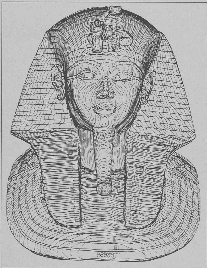
1) Le plan photogrammétrique ne donne pas seulement l'indication des surfaces en deux dimensions, il contient aussi des courbes de niveau très fines qui indiquent la troisième dimension comme dans une carte topographique — l'équidistance est de 1 mm. La restitution a été faite dans l'autographe Wild A10.

Ce travail a été exécuté à Toronto; les masques aux dimensions gigantesques — leur hauteur est de 2,90 m, alors que l'original présente la grandeur exacte d'un visage humain, soit 54 cm — ont été exposés devant le musée pour attirer l'attention des passants et les inciter à visiter l'exposition des trésors de Toutankhamon.