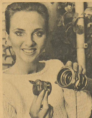
La fermeture pour citerne DOM TV-1.

... est une chose tout à fait possible maintenant grâce à un nouveau système de fermeture de sûreté pour citernes mis au point par les services techniques de la maison DOM. Ce système, applicable à la fois aux maisons uni- et plurifamiliales et aux