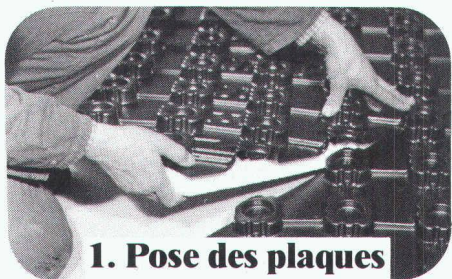
1. Pose des plaques

Plaques avec isolation thermique et phonique, barre vapeur et supports de tubes intégrés