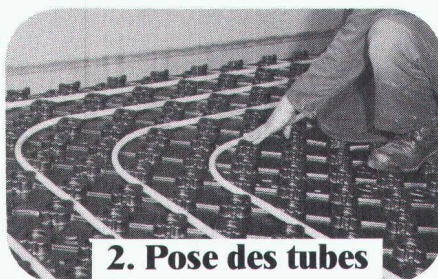
2. Pose des tubes

Plaques avec isolation thermique et phonique, barre vapeur et supports de tubes intégrés