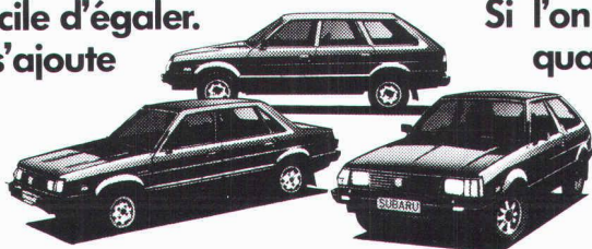
Subaru 1800 Sedan 4WD, Fr. 16 990.-

daire de la Subaru, il n'y a pas de doute: cette voiture dotée de la technique de pointe du Japon n'est pas seulement une bonne acquisition, elle restera aussi un bon investissement.