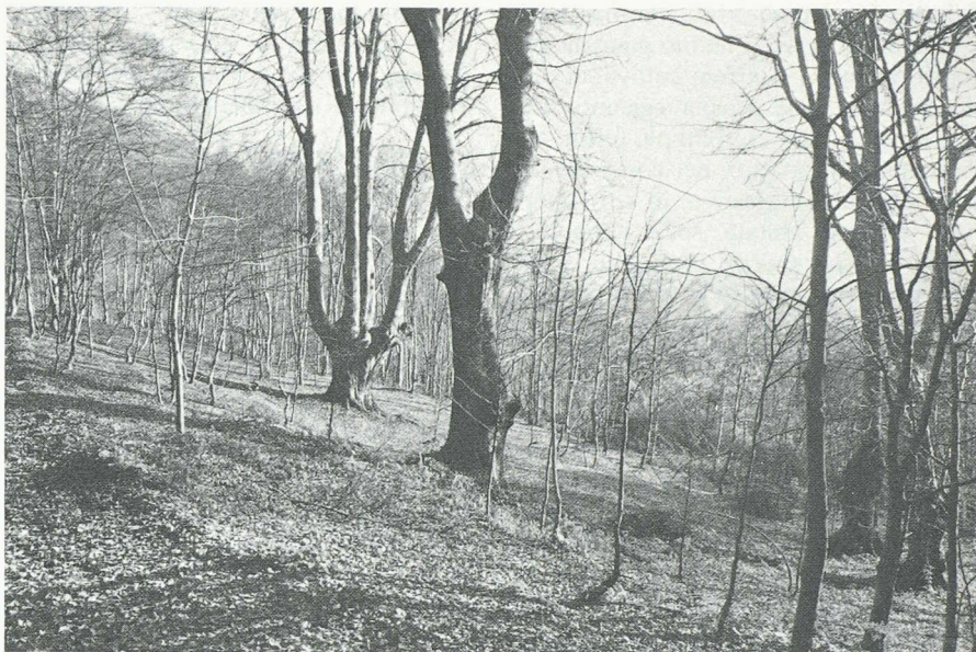
In tutto il Ticino è il faggio che domina nell'orizzonte montano (800-1400 m/sm). Il valore ricreativo di questa giovane faggeta è rinforzato dalla presenza di alcuni vecchi, maestosi esemplari.

Per soddisfare i bisogni dell'uomo moderno in fatto di ricreazione, il bosco non abbisogna in teoria di infrastrutture particolari. Certo fa piacere potersi spostare su di un comodo sentiero o su di una strada in terra battuta, ma queste infrastrutture sono di solito già presenti per altri scopi. In quelle zone dove la pressione turistica sul bosco è più forte, i Comuni interessati possono allestire semplici infrastrutture, d'intesa con il servizio forestale di circondario, per garantire che il bosco possa assolvere quelle funzioni di ricreazione richiestegli. Il potere ricreativo del bosco rimane comunque legato all'aspetto e all'atmosfera che gli alberi creano, siano essi castagni, faggi, tigli o larici, abeti e pini: ogni soprassuolo possiede una sua bellezza, alla quale non è facile restare indifferenti.