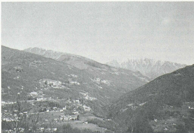
Val Colla. Il bosco è un indispensabile elemento del paesaggio ticinese e conferisce allo stesso una particolare attrattiva.