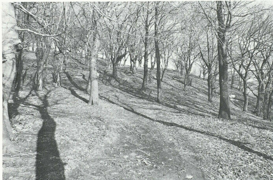
Una bella selva castanile. Esse erano un tempo molto frequenti attorno ai villaggi, oggi sono molto più rare da incontrare.