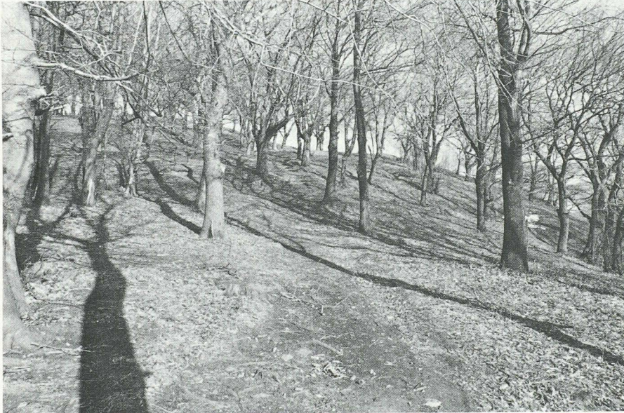
Una bella selva castanile. Esse erano un tempo molto frequenti attorno ai villaggi, oggi sono molto più rare da incontrare.