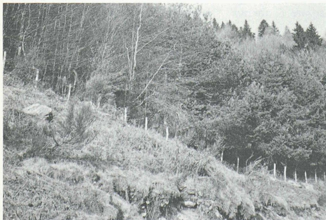
Piantazione mista in Malcantone (Arosio). La varietà delle specie presenti consente un inserimento armonico del nuovo bosco nel paesaggio.

Lo smercio del prodotto non dovrebbe essere difficile. Forse all'inizio ci potrebbero essere delle difficoltà a causa della mediocre qualità del legname, ma con il passare del tempo, grazie ai continui interventi selvicolturali, la qualità