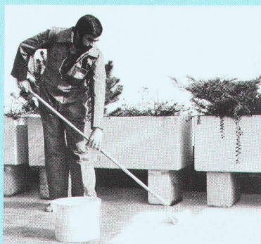
Résiste aux intempéries et aux mouvements.