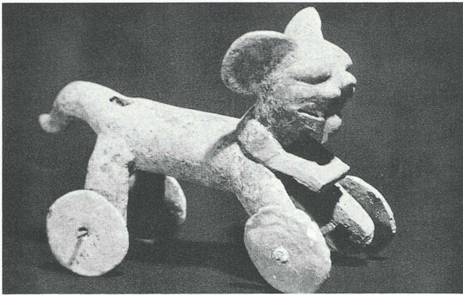
La roue: jouet seulement? Jaguar monté sur roulette, long de 18 cm, trouvé à Nopiloa (Etat de Veracruz), près de la côte du golfe du Mexique.

sites grandioses, aujourd'hui déserts, que nous montre l'auteur. On évoque le fourmillement bigarré qui devait les animer et l'on aimerait tant renverser le cours de l'Histoire pour éviter l'agonie de ces peuples, auquel ne nous relie aucune tradition, certes, mais qui ne nous en fascinent pas moins par leurs témoignages muets.