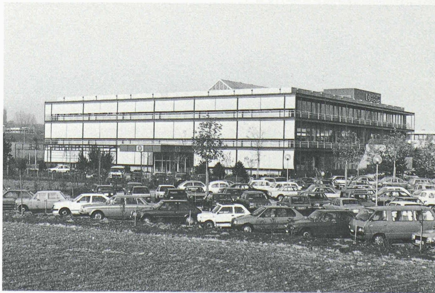
Fig. 2. — Façade sud-ouest, montrant les stores fermés sur les coursives.

Une fois formulé et quantifié, l'ensemble de ces besoins représente une surface de plancher d'environ 10 000 m 2 pour les 400 utilisateurs approximativement prévus. L'environnement de ce projet, constitué par des constructions abritant des programmes très diversifiés et industriels,