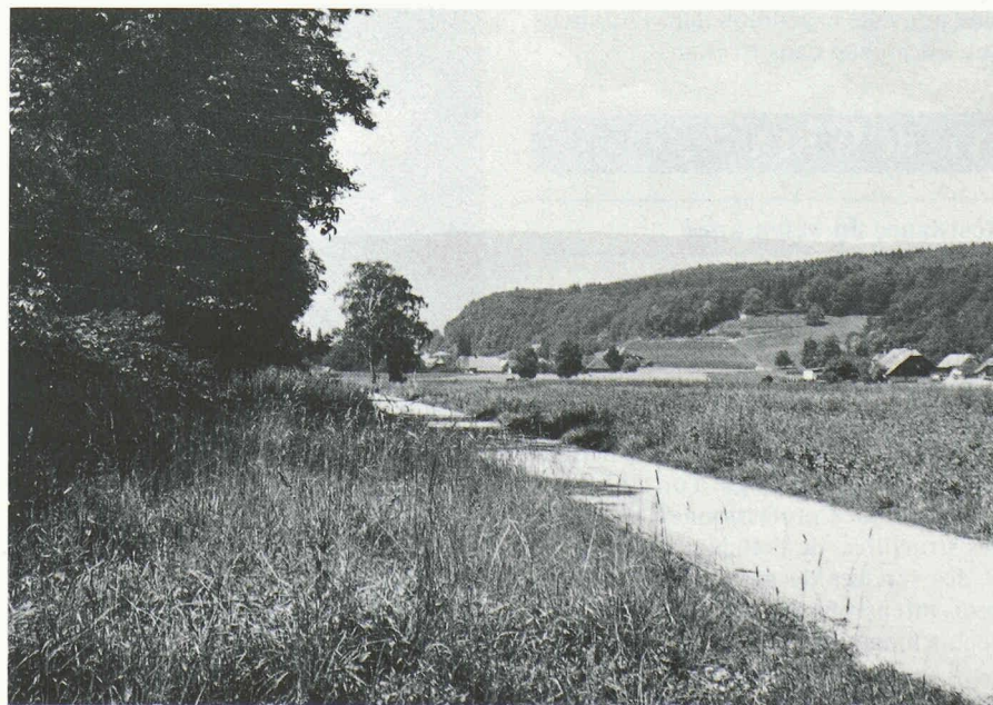
Séparation judicieuse entre réserve naturelle (à gauche) et exploitation agricole intense (à droite).