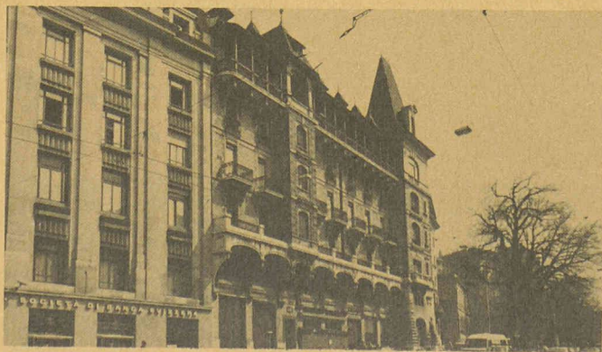
«Brûlé» en 1905, adoré en 1984: l'immeuble Camoletti!