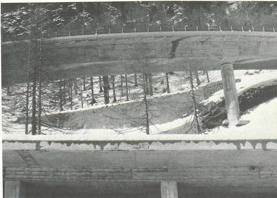
Fig. 2. — Pont sur le couloir d'avalanches de Furri, route du Simplon.

L'Institut précité classe généralement les avalanches en trois catégories selon la fréquence de leurs apparitions. Les avalanches fréquentes sont celles qui surviennent au moins une fois dans une période de trente ans et les avalanches rares celles qui se produisent au moins