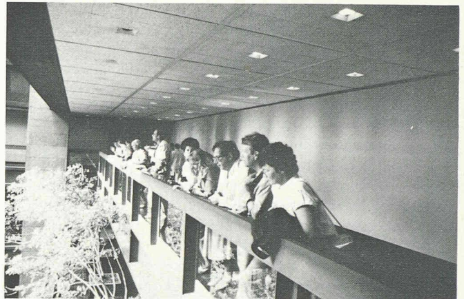
Rencontrer un conseiller d'Etat vaudois à New York!

East Harlem, les tristes quartiers périphériques de Bronx, Queens ou Brooklyn : à South Bronx, on dit qu'il y a 100000 appartements brûlés délibérément par leurs propriétaires, qui voulaient ainsi supprimer des bâtiments devenus non rentables. Et pendant ce temps, Wall Street : la danse effrénée des millions, des milliards de dollars qui changent de mains par la grâce d'un téléphone ou d'un écran d'ordinateur... I love New York? Allons-y voir! Départ pour Byzance!