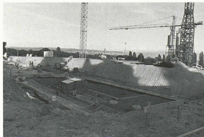
Le chantier de l'Ecole de la construction de la FVE: un magnifique pari sur l'avenir.