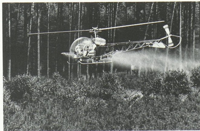
Dans les milieux agricoles, la mise en œuvre de produits chimiques de protection phytosanitaire en bon dosage — ici par épandage à partir d'un hélicoptère — s'avère inéluctable. Dans les pays du tiers monde également, l'agriculture et la sylviculture modernes ne peuvent pratiquement pas y renoncer.

Le fait d'approvisionner le tiers monde en produits phytosanitaires et en médicaments n'assure pas seulement la survie des pays