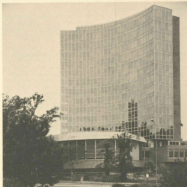
La tour de l'Organisation mondiale de la propriété intellectuelle (OMPI). Architecte: Pierre Braillard, Genève.

Une autre possibilité existait en utilisant des plans courbes qui détruisent l'effet de miroir pour ne retenir que l'effet de lumière. Or, par nature, la lumière change d'un instant à l'autre, donnant une vie intense à ce qui est terne, voire mort avec d'autres matériaux.