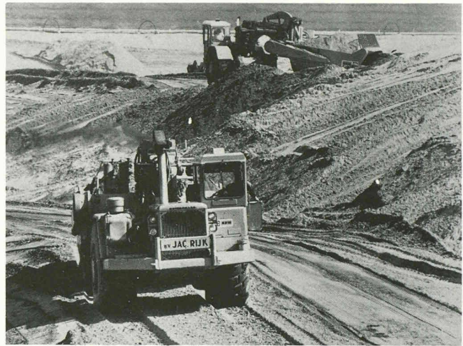
Scrapers automoteurs 631B Cat du parc de 20 machines Cat ayant participé au creusement des batardeaux pour la construction du barrage de l'Escaut oriental — un contrat qui nécessitait le déplacement de 2250 millions de m 3 de matériaux en quatorze mois.

Les effets de ce vaste système de protection des eaux sont sensibles, et notamment pour le Rhin qui, avec les flux de nappe phréatique de ses deux rives, fournit de l'eau potable à quelque 20 millions de personnes. Si, il y a quelques années encore, le Rhin était sale et son eau épouvantablement trouble, il offre de nouveau à l'heure actuelle — et malgré les accidents chimiques qui l'ont pollué récemment — un espace vital acceptable pour les espèces aquatiques animales et végétales. Sa teneur en oxygène a en effet augmenté jusqu'à son point de saturation, de 10 µg/l. Depuis 1971, la concentration en mercure et composés a chuté de 3,0 à