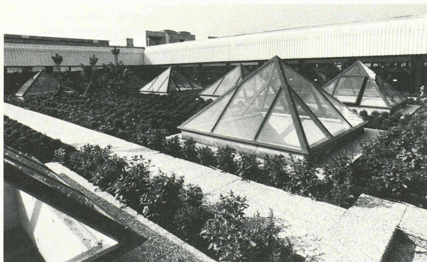
La toiture-jardin est terminée.