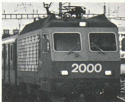
Rail 2000 : plus de temps à perdre !

L'élaboration des projets conclura à la nécessité d'ouvrages imaginatifs, lorsqu'il faudra satisfaire à de nouveaux critères techniques, écologiques et – last but