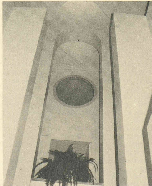
Maison particulière, Oberengstringen, 1986. (Architectes : Bétrix et Consolescia.)