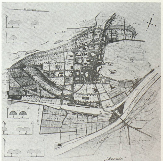
Sion au milieu des années vingt (à gauche) et telle que la voyait le lauréat du concours de 1927 (à droite).