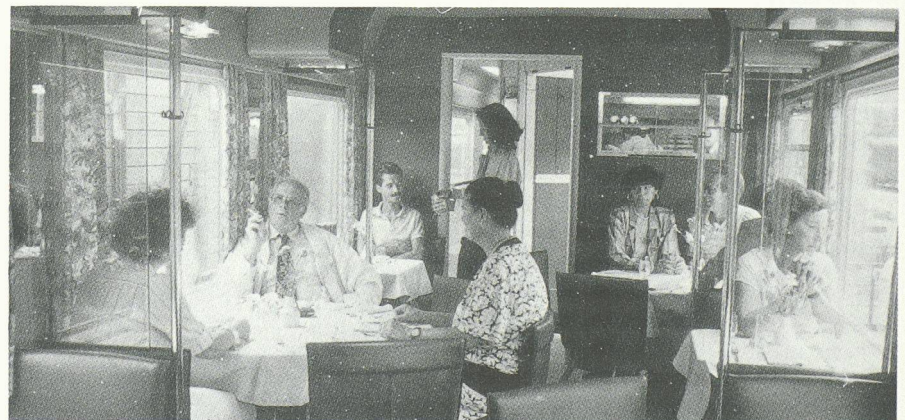
Une ambiance de classe pour une offre entièrement renouvelée.

traditionnel, passe-partout et servi selon une procédure excluant toute souplesse. La faveur va à des repas plus petits, plus légers et plus variés, disponibles à toute heure. Leur préparation dans une cuisine de bord est exclue. La solution choisie pour répondre à cette demande diversifiée s'inspire de celle adoptée depuis longtemps en aviation : la préparation centralisée dans une base fixe, située en l'occurrence à Genève. La méthode mise au point par le grand cuisinier français Georges Pralus recourt partiellement à la cuisson dite « sous vide » : les mets, préparés à base d'aliments parfaitement frais, sont cuits dans des sacs en plastique vidés de leur air puis immédiatement refroidis et intégrés à une chaîne de froid continue conduisant jusqu'aux voitures-restaurants, où ils sont « régénérés » dans un appareil mixte à vapeur. La fraîcheur des produits de base, l'hygiène dans la préparation, effectuée dans des locaux incomparablement mieux adaptés qu'une cuisine roulante, le maintien sous vide et à basse température jusqu'au réchauffement à la demande : autant de facteurs promettant une nouvelle qualité de restauration. Les dégustations comparatives ont classé