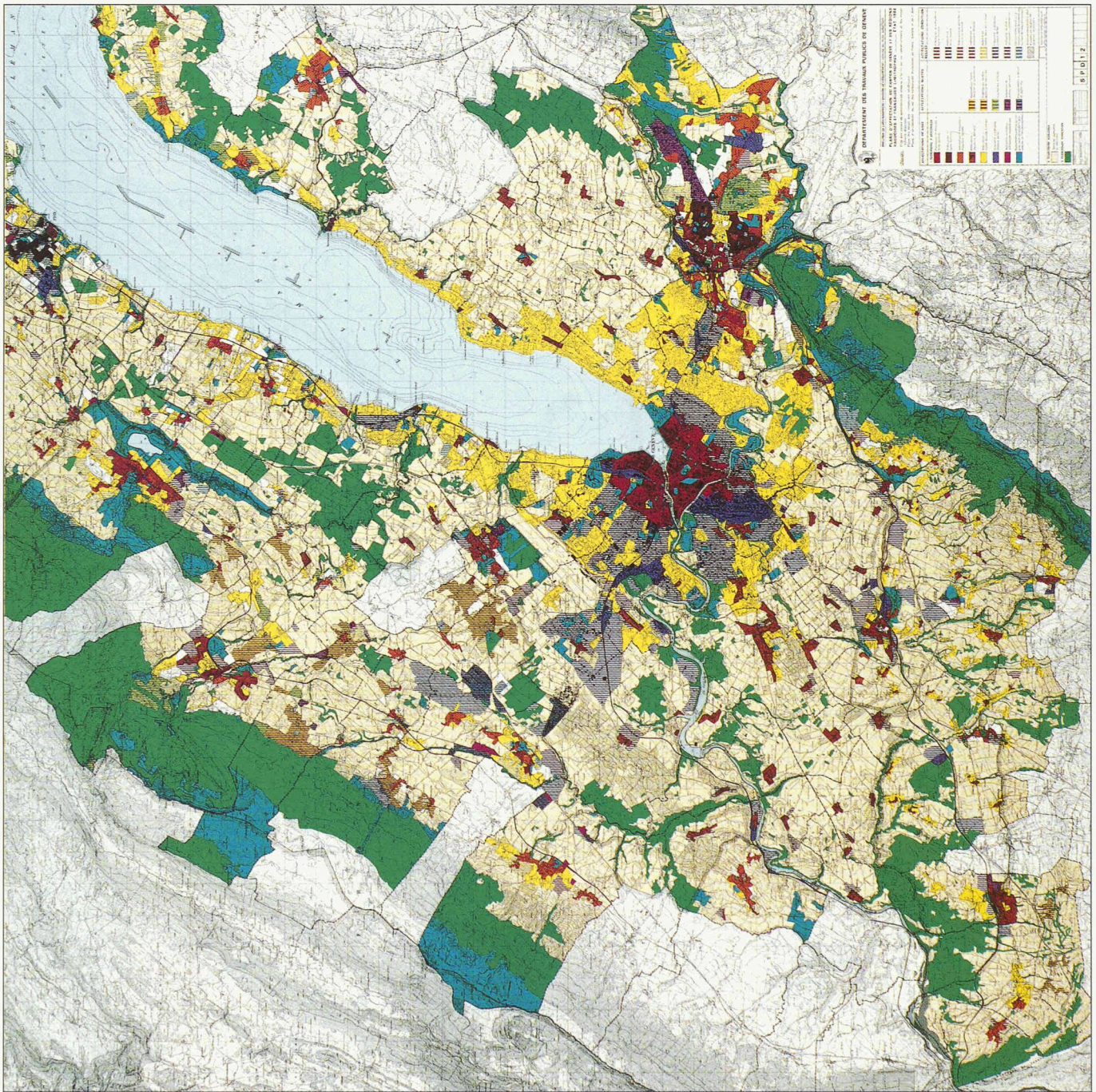
Region Genevensis – Plan d'affectation du canton de Genève et des régions limitophes: premier document transfrontalier du Département genevois des travaux publics, 1986 (ci-dessus).