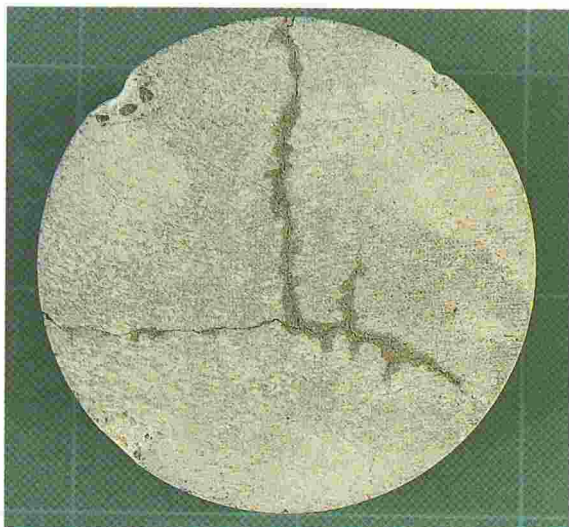
Fig. 7. - Carottage au droit de fissures.

sable à une amélioration de la qualité. Pour chaque chantier ou par tranche de 500 m 2 pour les constructions importantes, nous recommandons à l'architecte de prévoir le prélèvement de 6 carottes en divers points de la chape. Ces contrôles lui permettront de s'assurer :