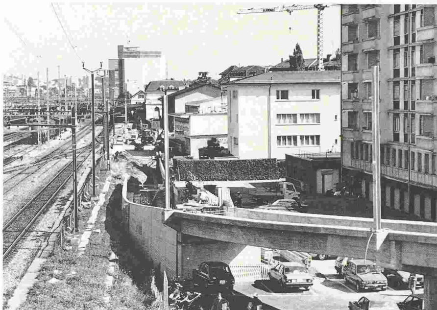
Fig. 25. - Pont d'Epenex.

Article préparé par la rédaction avec la collaboration des bureaux d'études mentionnés.