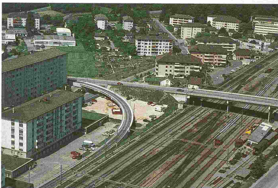
Fig. 26. - Pont d'Epenex: vue aérienne.