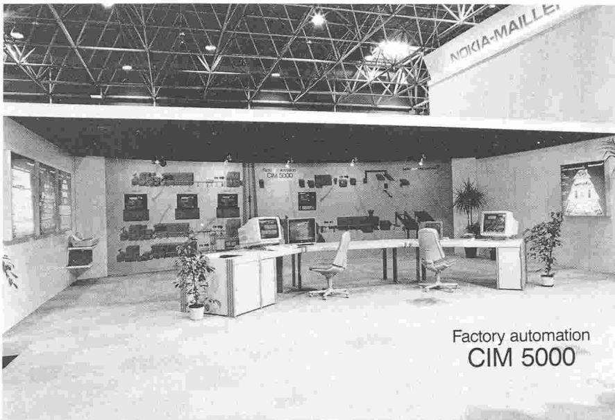
Fig. 3. - Wirex 1990.

CAM 5000 (Computer Aided Manufacturing), intégrant lignes d'extrusion, cellules de production et machines individuelles.