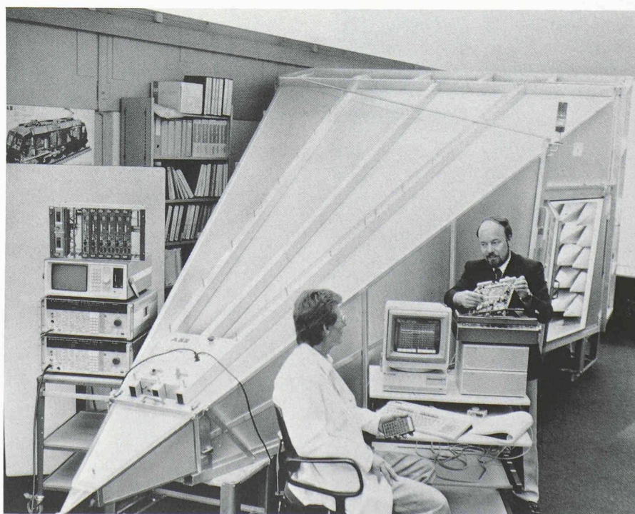
La cellule GTEM de l'EMI-Control Center ABB à Baden-Dättwil.

Un des instituts européens les plus importants de recherche, de développement et de consultation concernant tous les aspects des techniques de la CEM est l'EMI-Control Center de la maison Asea Brown Boveri SA à Baden-Dättwil.