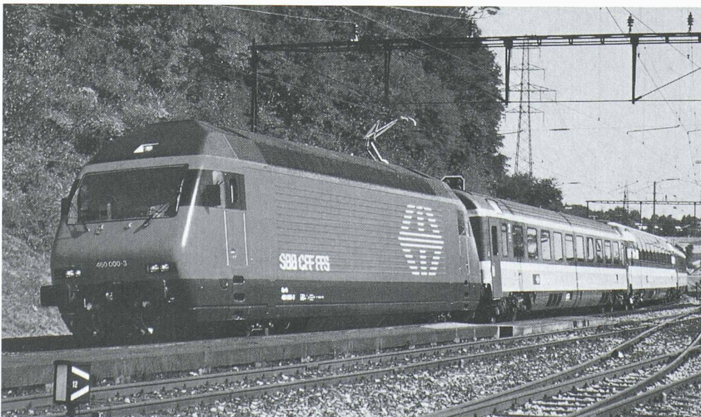
Les CFF à l'aube du XXI e siècle: locomotive dite 2000 (vitesse maximale: 230 km/h) remorquant une voiture pour services internationaux et une voiture panoramique (toutes deux homologuées pour 200 km/h)