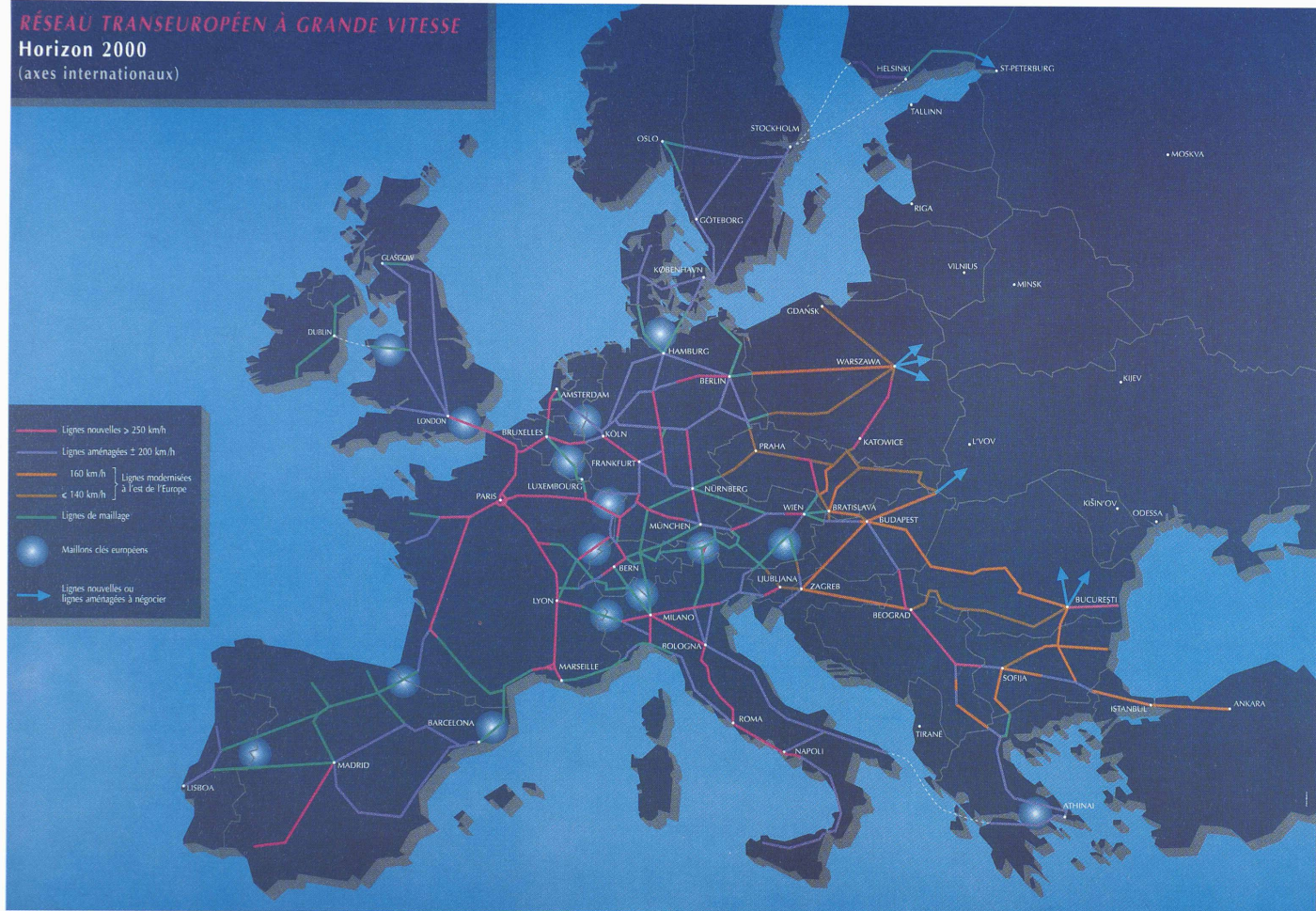
Le réseau ferré européen à grande vitesse de demain se trouve déjà en cours de réalisation: l'horizon 2000 vu par la Communauté des chemins de fer européens.