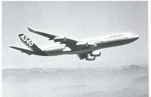
Le nouveau best-seller du constructeur européen Airbus Industrie: l'Airbus A340-200 (ci-dessus). Ce long-courrier peut transporter 262 passagers sur 14 400 km. Aperçu de la cabine de première classe (ci-dessous). Les chaînes de fabrication allemandes se trouvent à Brême et à Hambourg.

C'est toujours avec un très grand plaisir que nous prenons connaissance des remarques, des suggestions ou des critiques que nous adressent nos lecteurs. Si nous nous efforçons d'en tenir compte, il nous est malheureusement diffi-