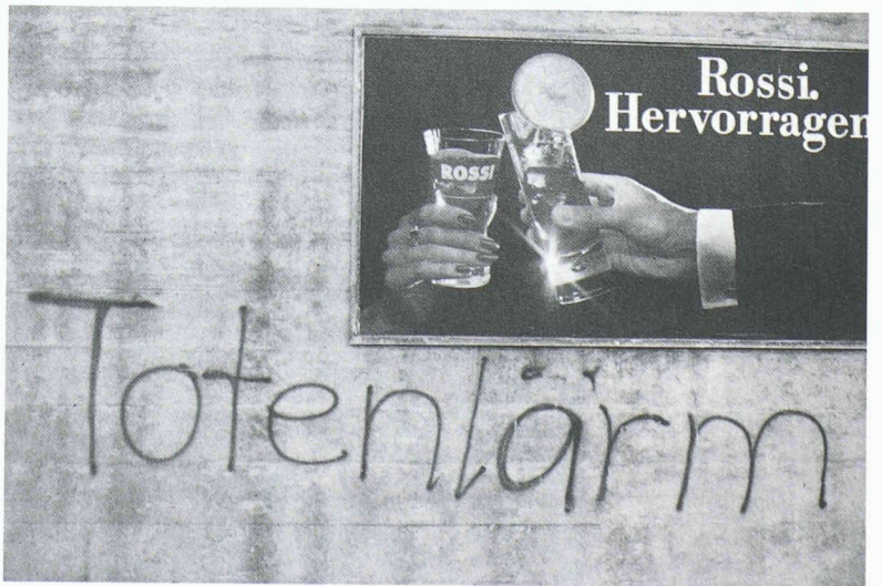
Fig. 8. - Un environnement agressif provoque des réactions agressives.

Pour conclure, ce qui est intéressant dans ce projet et diffère de l'ensemble de panneaux usuel est la cohérence entre la structure de l'information et sa mise en forme, tant au niveau des indications d'approche, que dans les bâtiments. L'aspect visuel des supports d'information joue