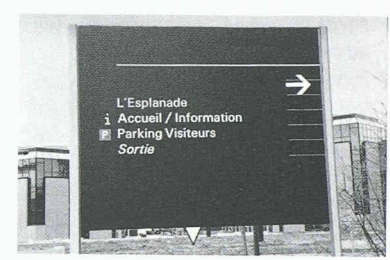
Fig. 7. - Système modulaire des supports d'information: il permet la réalisation des panneaux, du plus petit au plus grand.

En ce qui concerne l'emploi des pictogrammes, il a été réduit, le rôle de ceux-ci étant plus décoratif qu'autre chose. Cela peut surprendre, car c'est contraire à bien des idées reçues. Nous avons pourtant constaté que l'espoir qu'a pu susciter le pouvoir communicatif de tels symboles était infondé. Si, en effet, un contenu concret et très simple, comme l'idée de téléphone par exemple, peut effectivement être communiqué par un pictogramme, il n'en va plus du tout de même pour des contenus un peu plus différenciés, un téléphone à cartes ou un téléphone équipé pour le trafic international, notamment. Par ailleurs il n'est pas inutile de se rappeler, que le mot composé de ses caractères typographiques se constitue aussi une forte identité graphique sous cette forme, qui correspond à une entité apprise. (Ainsi, la succession des lettres formant le mot «Taxi» est-elle plus explicite, par exemple, que l'image d'une voiture vue de face avec un tout petit rectangle sur le toit). De telles entités ne peuvent sans autre être remplacées par une symbolique nou-