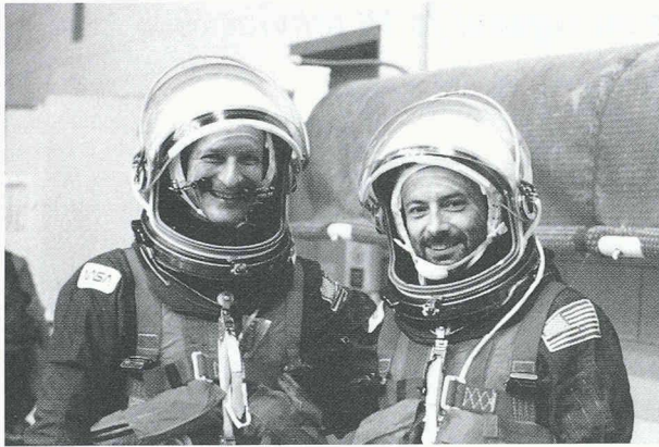
Les physiciens de l'espace: Claude Nicollier (à gauche) et l'Italien Franco Malerba, qui était en charge du satellite TSS.

riences relevant de la recherche fondamentale 3 .