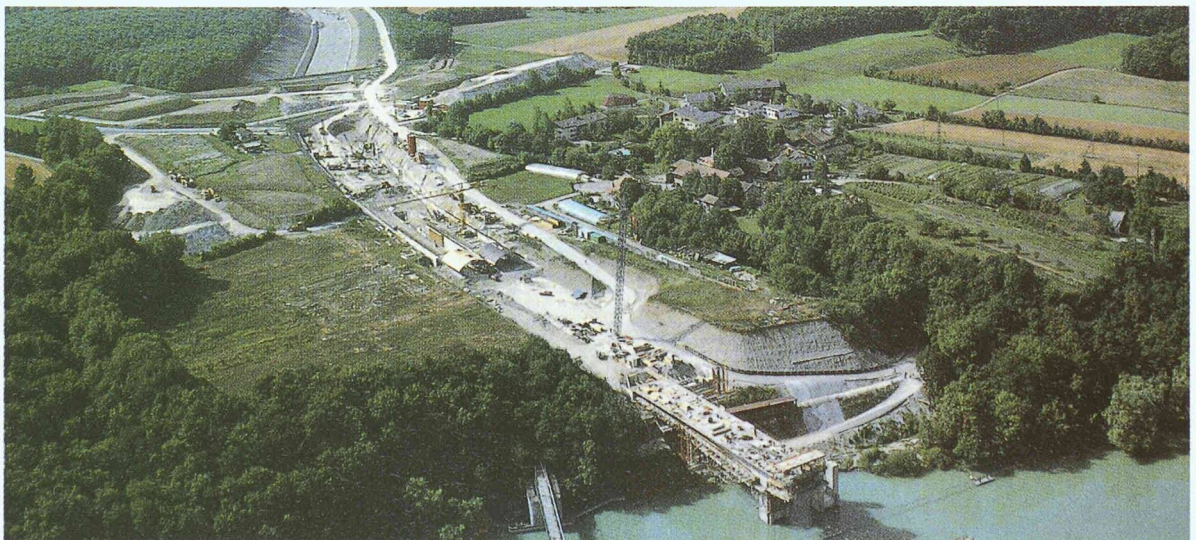
Fig. 3. – Tranchée couverte de Chèvres: photo du chantier avec, au premier plan, le pont d'Aigues-Vertes