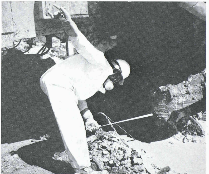
Fig. 4. – Contrôle de l'implantation d'une colonne de traitement par un technicien équipé selon le règlement de sécurité pour ce chantier

Mentionnons encore que le coût total de l'opération pour 1,5 hectare à traiter a été de l'ordre de 3,7 millions