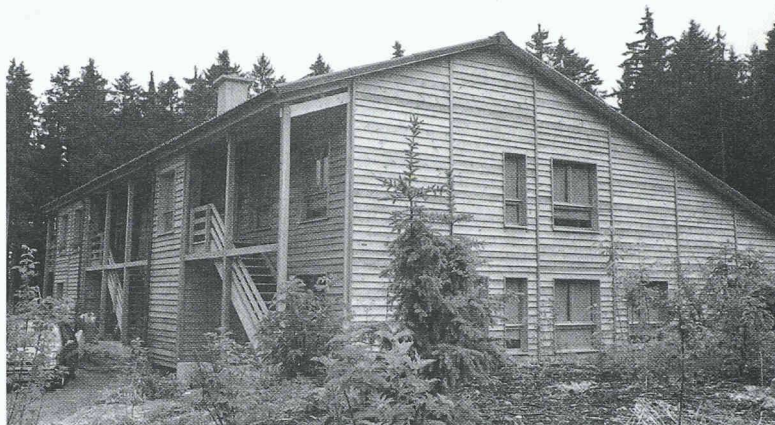
Fig.6 – «La maison de la forêt – au Boscal»: une réalisation originale basée sur l'utilisation de toutes les essences locales

chers, dalles, escaliers, portes, fenêtres, revêtements, etc.