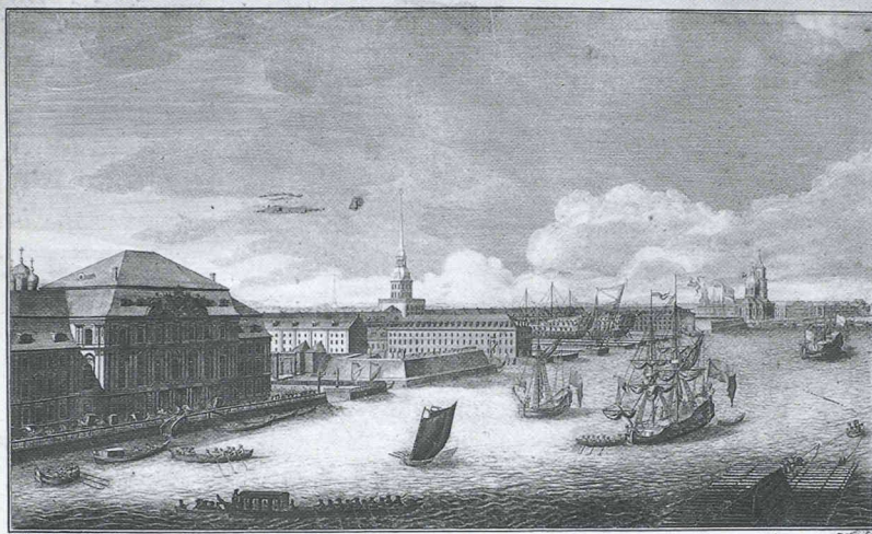
Проспектъ иль видъ по Невѣ рѣкѣ между зминимъ Ея Императорскаго Величества домомъ и Академіею Наукъ

Vue de la Néva, entre le Palais d'Hiver et l'Académie des sciences, 1750 1751. Eau-forte, 50 x 141 cm, Archives historiques d'Etat russes