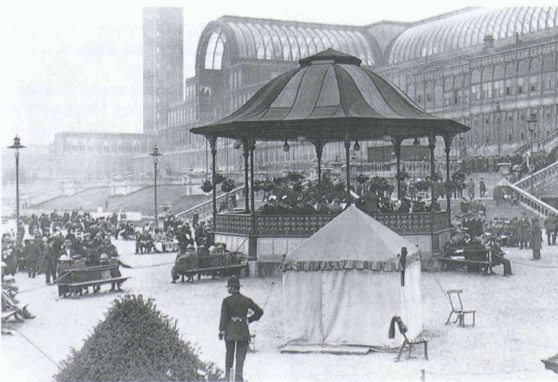
60 ans après sa destruction, le Crystal Palace suscite encore la nostalgie (notre photographie le montre servant de coulisse à une compétition de brass band). Il est question d'en édifier une reconstitution sur son site original pour l'an 2000, à l'occasion du millénaire de l'Angleterre.

La tendance architecturale actuelle tend à réaliser, dans le secteur administratif notamment, des immeubles toujours plus volumineux et, pour des raisons d'économie d'énergie et de confort, des surfaces vitrées toujours plus importantes. La recherche manifeste d'une flexibilité totale de l'organisation marque le passage du bureau individuel au bureau paysage qui peut constamment