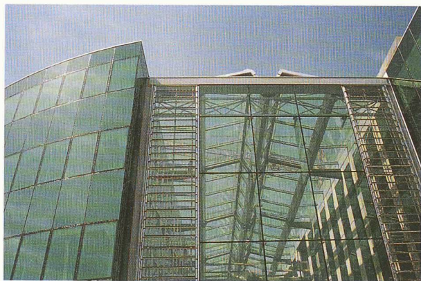
Le toit du hall d'entrée, en construction; grâce aux nombreux ouvrants et à une gestion précise des circulations d'air et de la température, la climatisation peut se faire de manière naturelle.

L'immeuble principal avec ses bureaux, son espace réservé à la recherche et son centre de formation, est conçu en deux segments de cercle, de construction semblable, situés de part et d'autre d'un vaste hall. Promouvoir la forme en demi-cercle n'a pas été chose aisée et pourtant elle a été adoptée par les responsables de Medtronic . Les deux segments de cercle légèrement décalés, rappellent la forme du cœur et apportent une dynamique au projet en rompant la monotonie de la symétrie. Quant à l'organisation des activités sur un plan circulaire, elle permet une variété dans l'aménagement des locaux qui répond à la diversité de leurs occupants venus de plusieurs continents. La concentration des circulations et des services au centre libère l'espace périphérique et permet une grande souplesse d'implantation du programme. Le hall devient ainsi lieu de convergence entre les deux secteurs et exprime la convivialité souhaitée entre les différentes fonctions, production comprise. Le hall d'accueil est relié à chaque niveau par un escalier central et deux ascenseurs latéraux. Au niveau 0, deux passages relient les services généraux à l'ensemble des locaux de production, pour une circulation fluide des visiteurs. Légèrement ouvert vers le lac, que l'on voit en transparence à travers les bâtiments, vitré de toutes parts