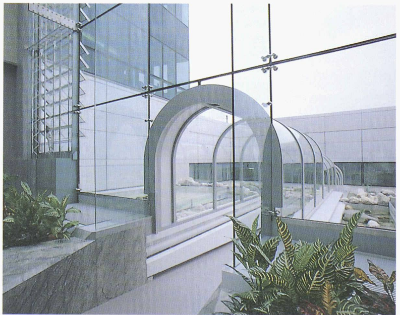
Couloir pour la circulation entre le bâtiment administratif et la production