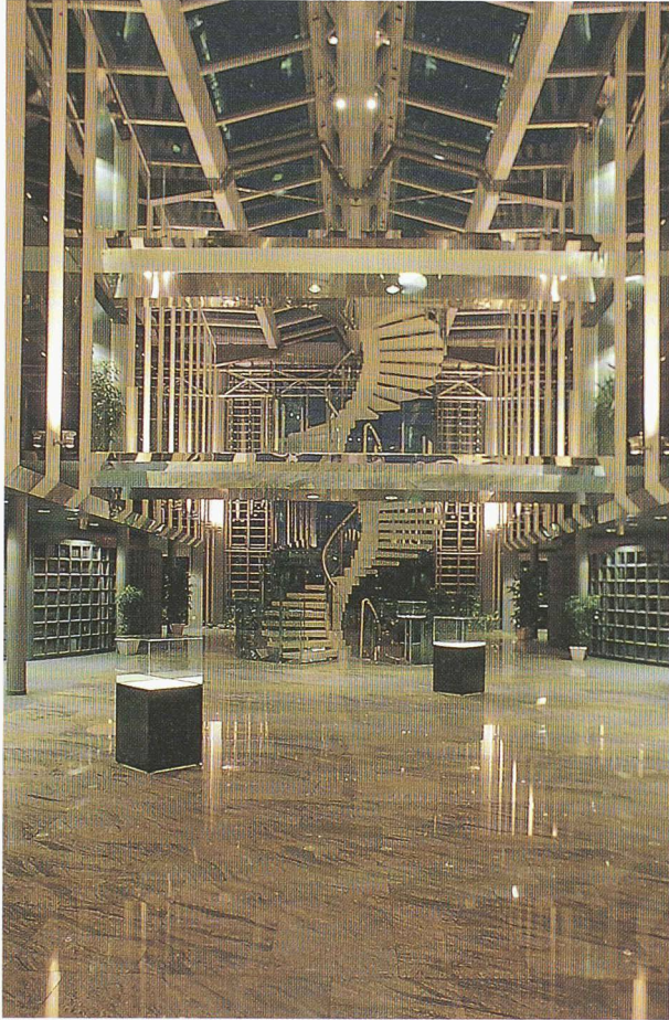
Le hall d'entrée illuminé

secteur ouest du bâtiment administratif. Il est en prolongement direct du hall d'accueil et de la réception. Il comprend :