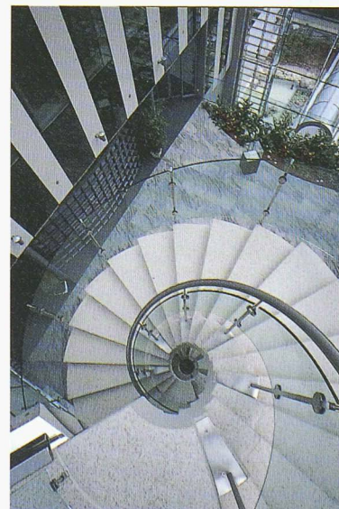
L'escalier reliant les différents niveaux du bâtiment administratif

Colomb, ingénieur-conseil, a également été déterminant, tant dans le respect du planning très rigoureux, que dans l'évaluation financière des coûts tout au long de l'opération, en conformité avec le budget établi par le maître de l'ouvrage.