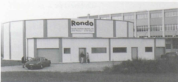
Expériences novatrices sur le chantier du parking d'Oberbüren: une construction ronde et, à la place du béton armé, un squelette en acier pour les futurs box où emmagasiner les véhicules