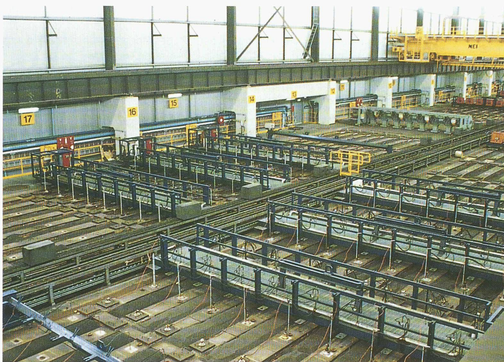
Fig. 5. – Four de calcination d'anodes: les systèmes de combustion (au premier plan) et de refroidissement se déplacent le long des traverses. Un cycle complet de cuisson et refroidissement dure deux semaines.