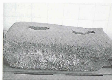
Fig. 2. – Anode endommagée par une combustion au CO_2

Fondateur de l'entreprise, Werner Fischer a installé sa propre installation pilote pour la production d'anodes. Pour comprendre plus finement le comportement de la matière, il a élaboré, au fil des années, une batterie d'instruments de mesure et de tests, simples et précis, applicables aussi bien dans les raffineries que chez les producteurs d'aluminium. La société fait figure de pionnier dans le domaine et a établi des références de qualité reconnues par l'ISO (organisation internationale de normalisation). Plus de cinquante types