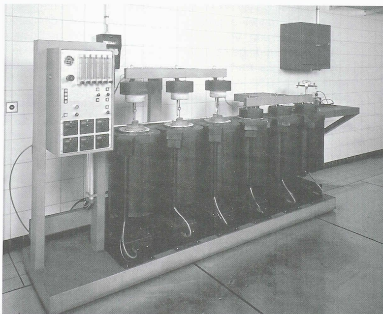
Fig. 1. – Installations de mesure de la réactivité des anodes au CO_2 . Les carottes sont chauffées puis refroidies et leur perte de poids est précisément enregistrée.

L'entreprise R&D Carbon Ltd s'est forgé une réputation internationale en offrant ses services aux producteurs d'aluminium, sur un élément apparemment secondaire de la production: l'anode de charbon. Douze années après son démarrage, cette PME sierroise est devenue leader mondial du test d'anodes et du contrôle de fabrication de ces dernières, avec plus de 50% du marché. Elle développe en permanence sa gamme de prestations à laquelle s'ajoutent le conseil et l'ingénierie de systèmes de production d'anodes complets, une façon de garder une avance importante sur la concurrence et d'élargir sa niche de marché.