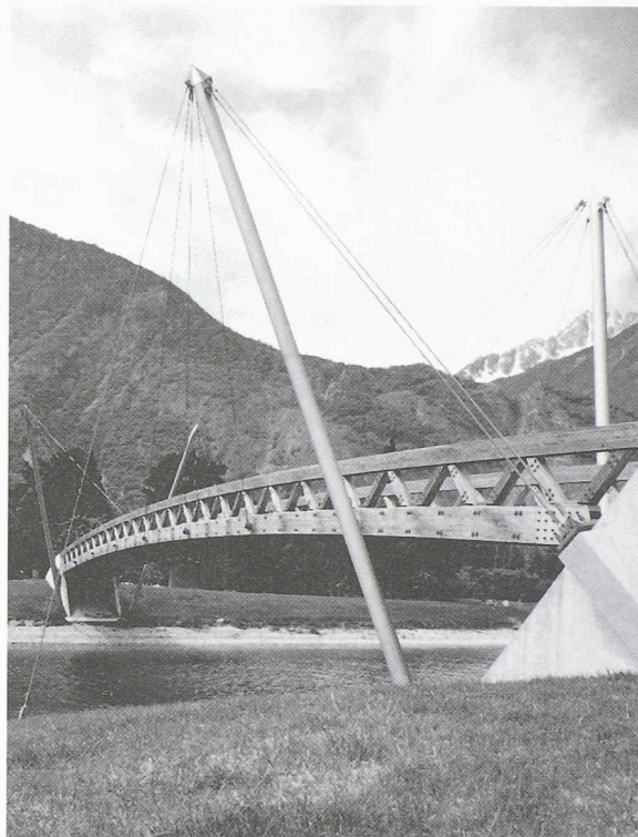
La Suisse bénéficie d'une riche tradition dans la construction de ponts. De nos jours, on utilise de nouveau le bois pour réaliser des ponts modernes. Exemple convaincant, tant techniquement qu'esthétiquement: la passerelle du restoroute de Martigny.

Schulz Munich (1990), Springer Heidelberg, 1993