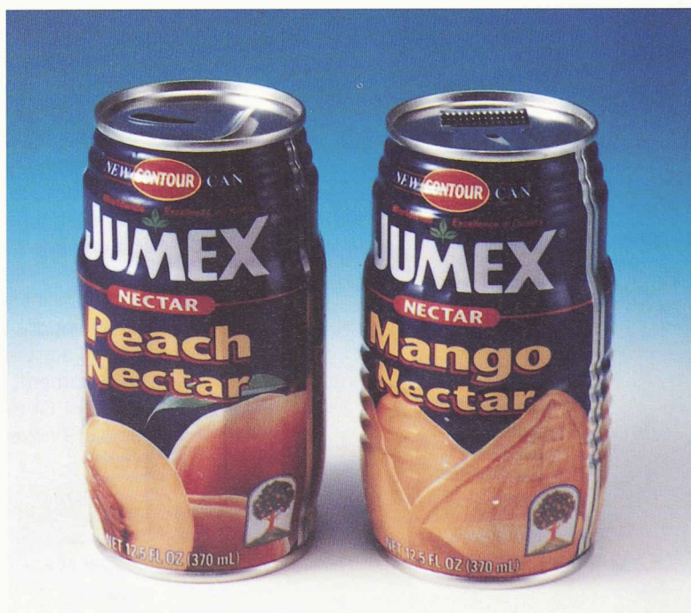
La géométrie des boîtes métalliques évolue, les méthodes de formage aussi, afin de garder les mêmes vitesses de remplissage sur les lignes de fabrication

– Le flacon en verre traditionnel a lui aussi évolué, de façon certes plus lente, mais avec des résultats surprenants. En effet, malgré son épaisseur, le bocal en verre clas-