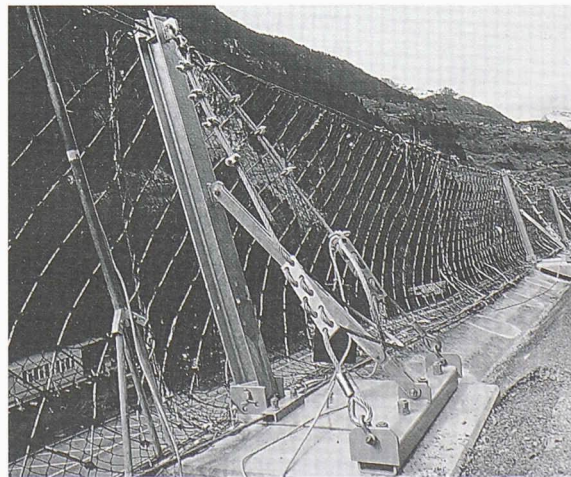
Fig. 3.- Filets de protection contre les chutes de pierres soutenus par des mâts à genouillère sur le couronnement des murs de soutènement