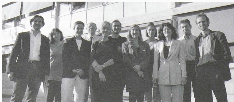
La première volée du cycle postgrade en architecture et développement durable a défendu ses travaux de maîtrise avec succès.