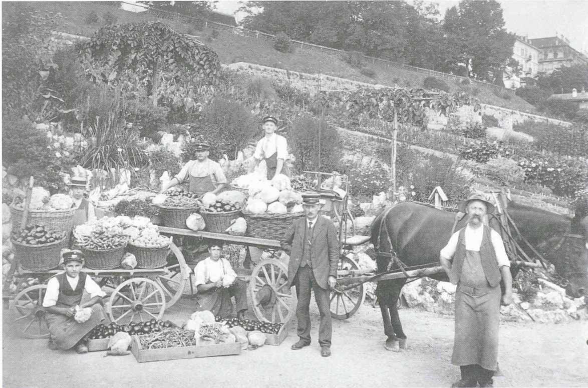
Fig. 2: Les jardins horticoles de la ville de Lausanne en 1912, sous l'esplanade de Montbenon. Ceux-ci seront déménagés en 1962 à la Bourdonnette, laissant place à un parking souterrain et à un édifice scolaire