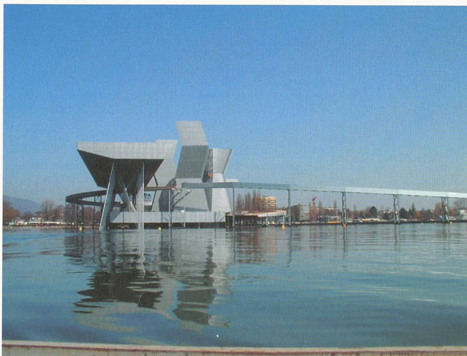
Plate-forme, passerelle et colonnes de l'arteplage de Bienne