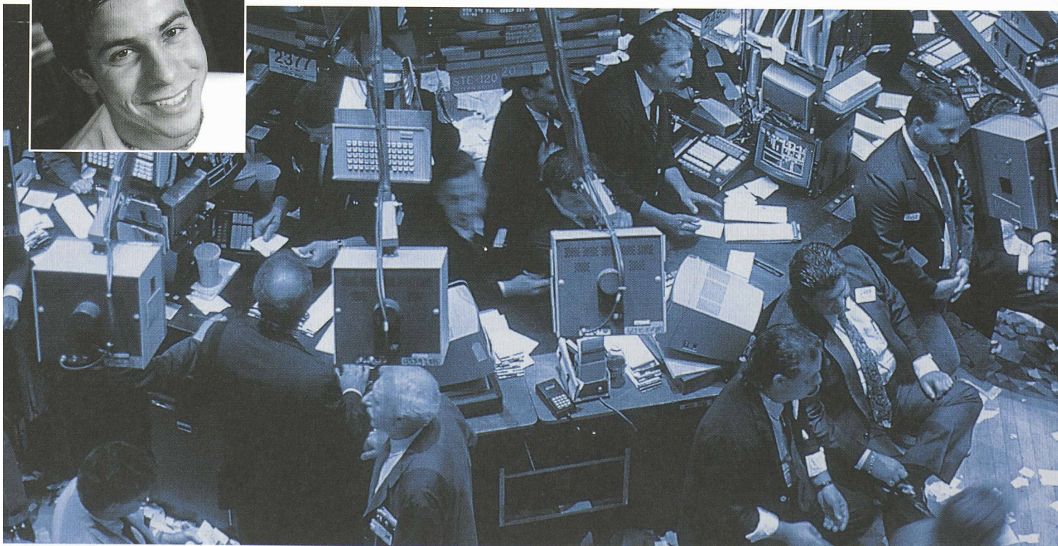
Câbles de transmission des données / bourse